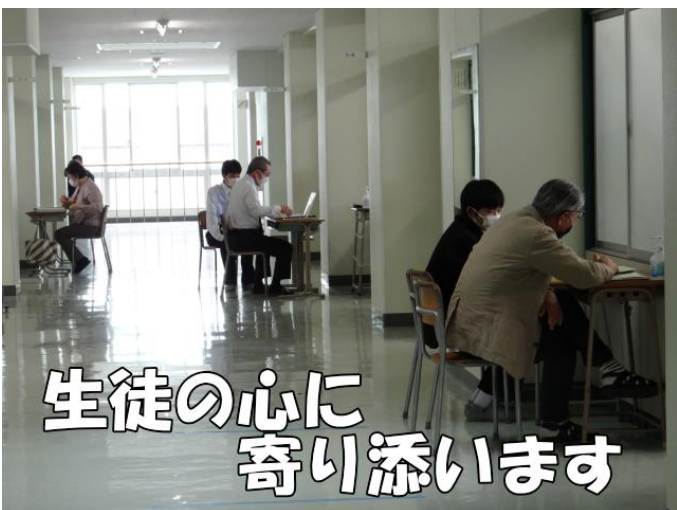
生徒の心に 寄り添います