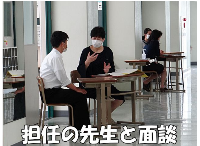
担任の先生と面談