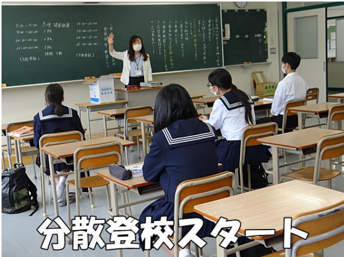
分散登校スタート

教室では、机を離して座って勉強をしたり、廊下で担任の先生と一人ずつ面談をしたりしました。帰る前には、自分の席や教室の扉、トイレの蛇口など、みんなが触れる部分を拭き掃除し、感染防止を行いました。