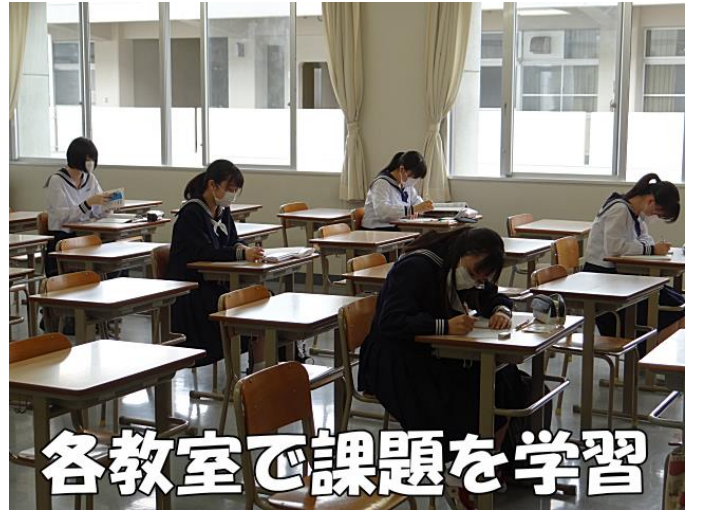
各教室で課題を学習